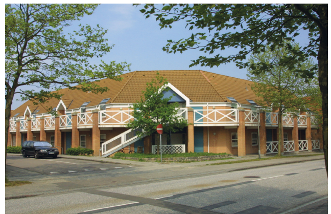
Ældreboliger Kildegården på Asylvej